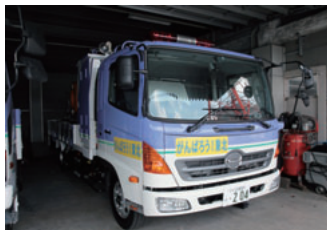
▲災害支援で活躍した排水ポンプ車

時として、私たちは自然から諭しを受けます。今回の東日本大震災からの復興には、長い年月と大きなエネルギーが必要となるでしょう。英知ある決断で、安らぐ日常を1日も早く取り戻したいですね。