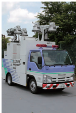
▲災害時、夜間の復旧作業や救助作業に欠かせない大型投光車