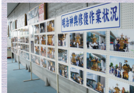
明治神輿修復作業状況

作業状況をパネルで展示中 しもだて地域交流センター1階で、明治神輿修復作業の様子を写真で紹介しています。ぜひ、ご覧ください。