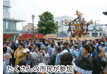
たくさんの市民が参加