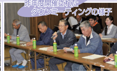
昨年度開催されたタウンミーティングの様子