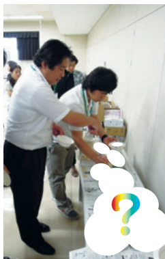
▲試食講評するメンバーたち。いいアイデアが浮かんできたでしょうか？