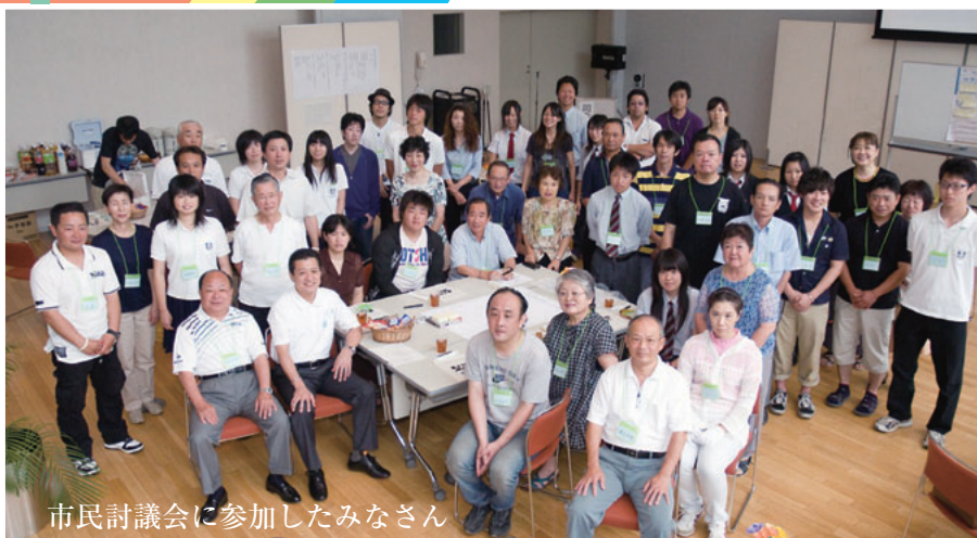
市民討議会に参加したみなさん