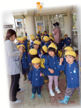
▲保護者のお迎えを待つ園児たち。元気いっぱい「国の宝」です。

「まだ、時折やってくる余震に、いつの時も気を抜けない」と、ふともらされた園長先生の真剣なまなざしに命を預かる厳しさを感じ、1日も早く平穏な日が戻ることを願わざるを得ませんでした。