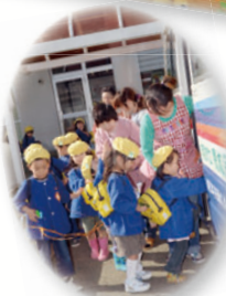
▶幼稚園・保育園児一緒にバスに乗ります。