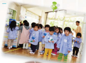
▲みんなで作業をする園児たち。