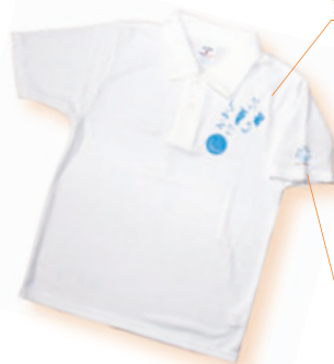
オリジナルポロシャツ

「みんなの力が集まれば、大きな力になって困難に立ち向かっていける。」ということを、被災地へのエールを込めて表現しています。