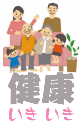
表1は、平成21年5月の1か月間に、主な生活習慣病の治療にかかった筑西市の医療費です。医療費総額の1/5が生活習慣病で占められ、中でも高血圧性疾患がトップになっています。 高血圧予防のポイントとは、早期発見です。生活習慣をすぐに変えることは難しいかもしれませんが、少しでも意識して改善していくことが大切です。 まず、自分の血圧を知るために家庭や健康診断等で定期的に測ることから初めてみませんか？

高血圧は、自覚症状はほとんどありませんが、放っておくと動脈硬化が進行する割合が高くなり、脳卒中や心臓病などの生活習慣病を引き起こす場合があります。