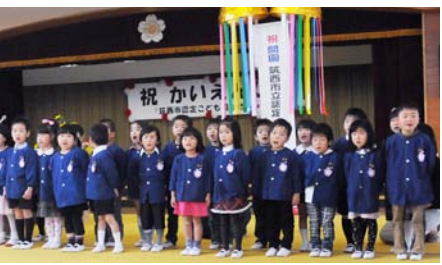
▲認定こども園せきじょうの開園式の様子

筑西市立初の認定こども園が幼保一体化により開設。認定こども園は、「就学前のこどもに関する教育・保育等の総合的な提供の推進に関する法律」に基づき管理運営を行います。