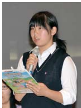
9/28 下館地区 参加者56人 地域交流センター

▼市内の公共交通機関の充実 ▼下館旧市内の町名復活▼合併後の行財政改革の進捗について▼住宅用火災警報器の設置（自治会としての取り組み） ▼下館駅東西踏切の交互交通の推進▼デジタル放送受信困難地区への対応▼下館駅前通りの活性化▼企業誘致と雇用の確保▼スピカビルの売却動向についてなど