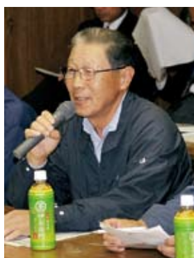
10/21 関本地区 参加者39人 関本公民館ホール

▼筑西市民病院の今後の方針 ▼所在不明や身元確認がとれない高齢者の現状と対策▼元気な高齢者のための生涯学習事業の充実▼地域の広場でのラジオ体操の実施▼ウォーキングしやすい道路の整備▼進学を希望する生徒への公的支援▼公共施設を結ぶ巡回バスの運行▼小中学校校舎の耐震化工事の進捗状況など