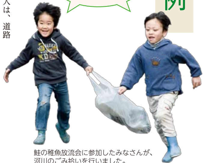
鮭の稚魚放流会に参加したみなさんが、河川のごみ拾いを行いました。