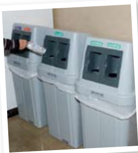
自販機で飲料を販売する事業者は、空き缶などの回収容器を設置しなければなりません。