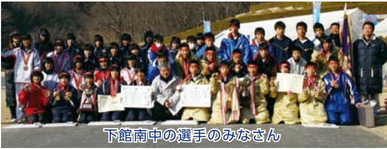
下館南中の選手のみなさん

下館南中学校からは駅伝部の男女各2チーム出場し、男子Aチーム、女子Aチームがそれぞれ優勝。今回の優勝で、男子は3連覇、女子は4連覇の快挙となりました。