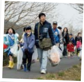
不法投棄を防ぐためにも、ごみが捨てられにくい環境づくりが大切です。

不法投棄、ポイ捨てなどを防止し、きれいなまちづくりを推進するため、防止策を講じ、積極的な啓発活動に努めます。 また、地域できれいなまちづくりに積極的に活動している団体に対して支援を行います。