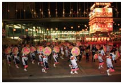
踊り子が揃った 水越 武夫 (筑西市下江連)