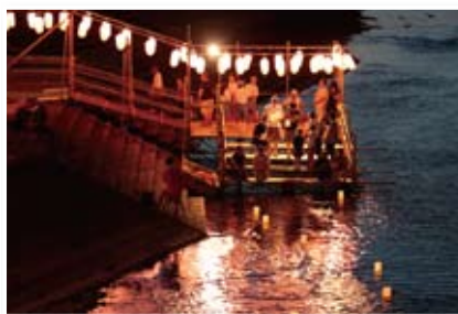
灯ろう流し 酒井 永 (桜川市犬田)