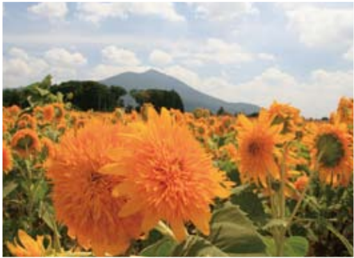
夏はひまわりが一番 大倉 節子 (下妻市下妻)