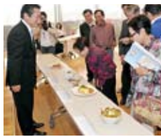
最終審査に残った5人の料理に観客も興味津々。吉澤範夫市長も審査員として料理を試食しました。