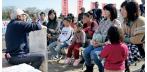
多くの家族連れが、鮭の生態や母川回帰のレクチャーを受け、改めて生命の神秘に触れていました。

ましたが、その鮭たちが生まれ育った川に戻っているものと思われず。11月6日には、しもだて紫水ロータリークラブ(ふるまみずわたり)主催による「鮭の遡上」が、その鮭たちが生まれ育った川に戻っているものと思われず。11月6日には、しもだて紫水ロータリークラブ(ふるまみずわたり)主催による「鮭の遡上」が、その鮭たちが生まれ育った川に戻っているものと思われず。