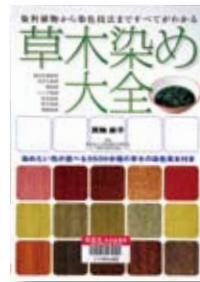
草木染め大全 著：箕輪 直子 監修：日本余暇文化振興会 【誠文堂新光社】

◆藍 あゐ の生葉染め、花びら染め、煮染め、ハーブ染め…。家にながらにして大自然を満喫できる、実践的な草木染めのノウハウを、3,500余種の草木の染色見本とともに収録。