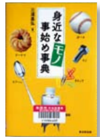
身近なモノ事始め事典 著：三浦 基弘 【東京堂出版】

◆カタチには「わけ」がある。リップ、ネジ、牛乳パック、眼鏡など、身近なモノの由来や仕組みについて、技術の視点で見るモノの文化誌。『技術教室』連載を元に書籍化。