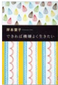
できれば機嫌よく生きたい 著：岸本 葉子 【中央公論新社】

◆いよいよアラフォー＆おひとりさま。そして、心の「鮮度」を保つのが、いちばんのアンチエイジング！不透明な世の中を機嫌よく生きるためのヒントを満載したエッセイ集。