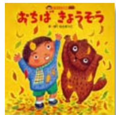
おちばきょうそう 作・絵：白戸 あつこ 【ひさかたチャイルド】

◆たつくんがじいじのにわの落ち葉をはいていると、たぬきがひよっこりあらわれ、ふたりはおちばをあつめるきょうそうをはじめましたが…。秋のふんいきたつぷりの絵本です。