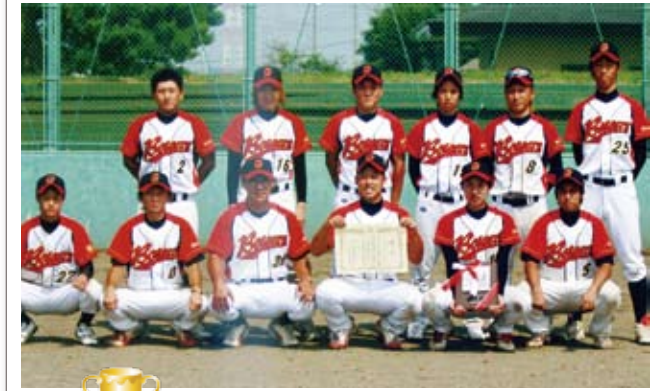
優勝 ボーイズ 準優勝 零