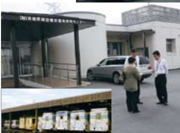
◀ 健診協会 県西センター事務所の様子