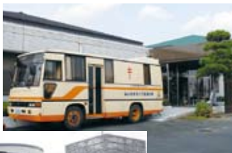
▶ 保健センターで行われた健診の様子

では、なぜ健診が必要なのでしょう? ほとんどの病気は、発見が早ければ早いほど治る確率が高くなります。特に、自覚症状のない初期の段階でからだの異状を見つけることができれば、