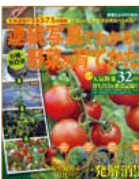
成長過程の写真575展掲載連続写真でわかる! 野菜の育てかた 野菜だより特別編集 【学研パブリッシング】

◆春まき・秋まきの人気野菜32種を、種まきから収穫まで成長過程の連続写真で。土づくりなど、はじめて家庭菜園に取り組む人や、野菜づくりを確認したい人に参考になる一冊。