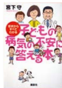
子どもの病気の不安に答える本 作：宮下 守 【講談社】

◆発熱、咳 せき 、嘔吐 おうと 、下痢などの日常の気になる症状から子どもの病気がわかるガイドブック。6歳までの子どもの病気の9割を解説。事典ではなく貸し出し可能な医学書。