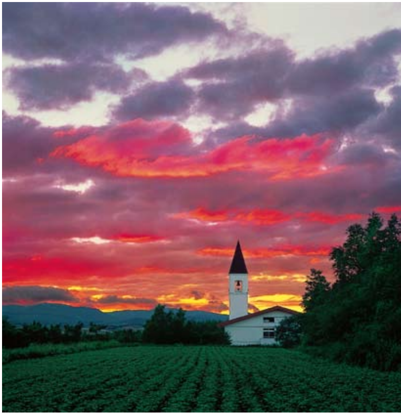
「夕焼けの塔」北海道美瑛町 1990年