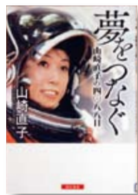
夢をつなぐ 山崎直子の四〇〇八八日 著：山崎直子 【角川書店】

◆宇宙飛行士候補者試験に合格してから、宇宙からの帰還までの記録。爆発してしまったチャレンジャー号に搭乗していた女性教師の夢をつなぐという思いが実現した。