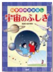
宇宙のふしぎ 監修：松井孝典 【PHP 研究所】

◆地球みたいな星はほかにあるの？流れ星はどうして見えるの？火星にも山や川があるの？オーロラはどうしてできるの？宇宙について気になる疑問をわかりやすく解説。