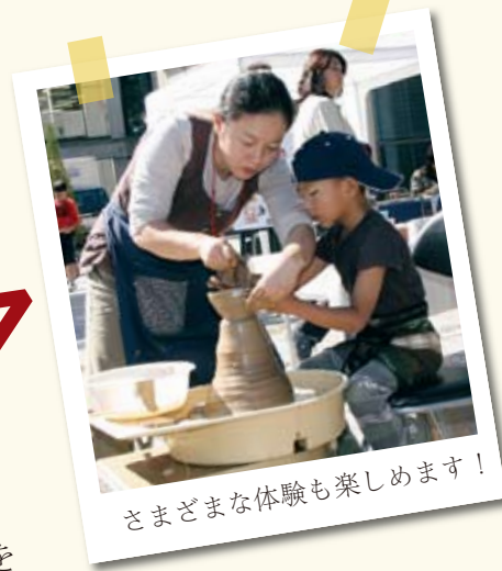
さまざまな体験も楽しめます！