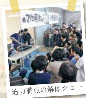
迫力満点の解体ショー