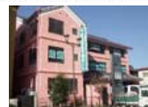
東進衛星予備校 (下館駅北校) スピカ裏