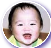
おおくぼ りょうま 大久保 怜真くん 10月27日生(小川)