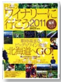
日本のワイナリー に行こう 監修・著：石井 もと子 【イカロス出版】

◆期待高まるビッグなワイン産地・北海道を特集するほか、日本全国の148ワイナリーガイドをエリア別に掲載。「塩尻」ワイナリー・ウォーキングマップ付き。