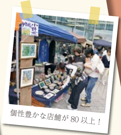
個性豊かな店舗が80以上！