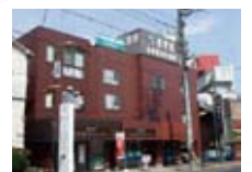
志学教育センター (下館駅前校)