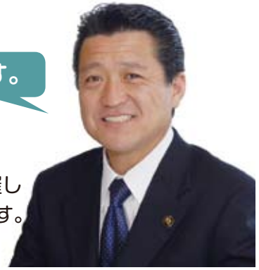
筑西市長 吉澤範夫