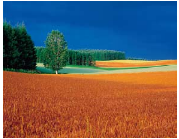
「麦秋多彩」北海道美瑛町 1977年