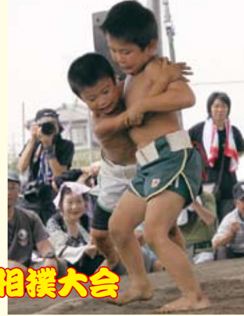
ちびっ子相撲大会