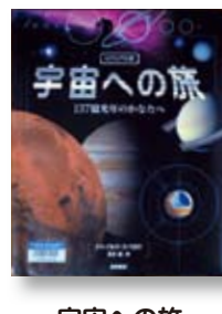
宇宙への旅 ビジュアル版 作：ジェイルズ・スパロウ 訳：富永 星 【岩崎書店】

◆最新の宇宙探査機からのデジタル送信画像を駆使し、宇宙空間における最新の事実と様々な情報をビジュアルで紹介している。宇宙への旅を体験した気分：。内容の充実した児童書。