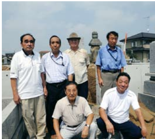
▲五輪塔継承に立ち上がった地元自治会のみなさんと現在工事中の五輪塔

地域が一体となって活動しているところ、どこにあるのかといった問い合わせが自治会にあつたり、ウォーキン