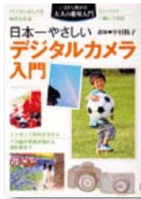
日本一やさしい デジタルカメラ入門 著：中村 陽子 【主婦の友社】

◆パソコンなしでも始められるデジタルカメラの入門書。ストラップの付け方からプロ級の写真が撮れる撮影術まで、作例やイラストを交えて解説。コンパクト・一眼レフ対応。