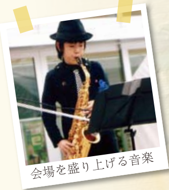
会場を盛り上げる音楽