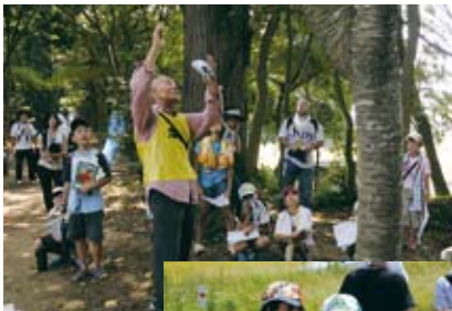
▲宮の杜里山では里山の役割などを学ぶ