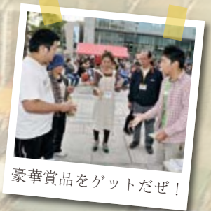
豪華賞品をゲットだぜ！

■問い合わせ / しもだてアートフェスタ実行委員会 ☎ 24-5396 (諏訪) 公式 HP www.shimodate-af.com