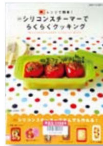
シリコンスチーマーで らくらくクッキング 著：杉山 アキコ 【主婦と生活社】

◆朝ごはんから、おかず、お弁当おもてなし料理、おやつまで、シリコン製の調理器具「シリコンスチーマー」ひとつで完成できる幅広いメニューを紹介。ベストレシピも掲載。