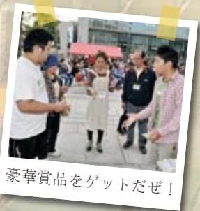
豪華賞品をゲットだぜ！

■問い合わせ / しもだてアートフェスタ実行委員会 ☎ 24-5396 (諏訪) 公式 HP www.shimodate-af.com