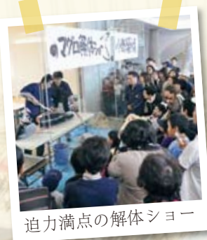
迫力満点の解体ショー