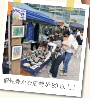
個性豊かな店舗が80以上！