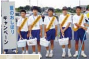
暑さに負けず、しっかりと仕事をこなしました。

進路指導の一環として市内の中学校が実施している職場体験学習で、8月2日と6日の2日間、中学2年生17人が市役所の仕事を体験しました。生徒たちは、交通安全キャンペーンやひまわり畑の手入