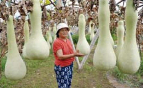
4種類のジャンボひょうたんを畑で栽培

各方面で活躍中の「シニア世代」のみなさんに、日ごろの活動や生涯現役の秘訣などをお聞きます。