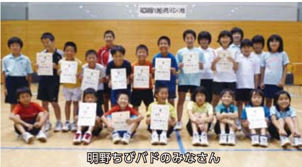
明野ちびバドのみなさん

☆入賞した明野ちびバド入賞者は、8月28日に行われる県予選に出場し、関東予選を目指します。