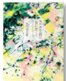
ステキな詩に会いたくて

◆谷川俊太郎、茨木のり子、アーサー・ビナードなど不動の人気を誇る詩人を含む54人が登場。作品の紹介や詩人のエピソードを綴る1冊。『中日新聞』連載を改編、加筆して単行本化。