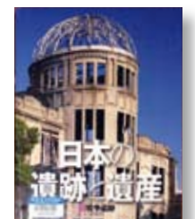
日本の遺跡と遺産

◆日本が経験した戦争・原爆。悲惨な戦争を後世に伝えるため、軍隊施設・戦場・収容所など全国の戦争遺跡を紹介。日本各地の遺跡や遺産を紹介する全7巻シリーズの1冊。児童書。