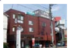
志学教育センター (下館駅南校)