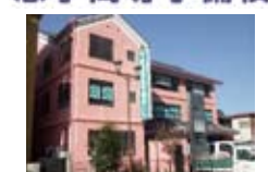
東進衛星予備校 (下館駅北校) スピカ裏