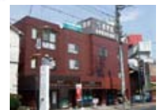
志学教育センター (下館駅前校)