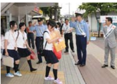
下館駅を利用する高校生を中心に非行や犯罪防止を訴えるキャンペーンを実施しました。