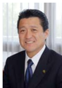
筑西市長 吉澤 範夫

安心安全の医療を守るためには、公立病院と民間医療機関との連携が不可欠です。緊急時の患者受入体制の充実を図り、「患者のたらい回し」などが絶対あってはなりません。県の再生計画では、市民病院と県西総合病院を統合した中核病院の整備と既存病院のサテライト化、民間医療機関との連携などネットワーク化構想が盛り込まれています。新中核病院の建設位置については有識者による検討委員会で議論されますが、患者の利便性や他の医療機関との連携などを考慮して慎重に定めなければなりません。自分たちの病院はどんな病院が良いのか、市民の皆さんのご意見もお待ちしております。