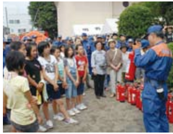
避難所に集まった参加者は、消火器の使い方やケガなどの応急処置法を学びました。

県では、土砂災害防止法に基づき、平成21年度に筑西市内12か所（下館・関城地内）を警戒区域に指定しています。