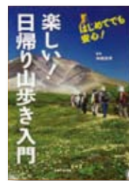
楽しい！日帰り山歩き入門 監修：神崎 忠雄 【主婦と生活社】

◆気軽にはじめられる日帰りの山歩き。登山の準備、登る山の選び方、歩き方、トラブルへの対処法などを解説。日帰り山歩きおすすめコースガイド付き。