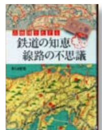
古地図でたどる鉄道の知恵 線路の不思議 著：井口 悦男 【草思社】

◆元古地図学会会長で鉄道趣味歴70年の著者が、鉄道史上から全国31か所のおもしろポイントを、地図・時刻表・写真などの資料で読み解く。水戸線・両毛線も解説がある。