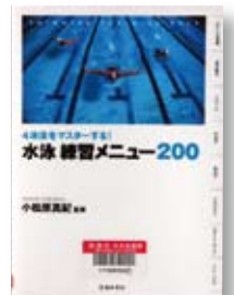
水泳練習メニュー200 監修：小松原 真紀 【池田書店】

◆基本動作からクロール、平泳ぎ、バタフライまで、泳ぎの全てを完全網羅。スタート、飛び込み、ターン、家でできるトレーニングなど、200種類の練習メニューを連続写真で紹介する。