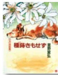
種蒔きもせず 著：星野 富弘 【偕成社】

◆描いているものから、筆を通して、喜びや優しさ静けさ強さなど、生きていく力を私と与えられていたのである…。2003年以降に描かれた作品を中心に65点を収録した詩画集。