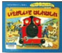
いそがしいぞはしれはしれ 作：ベネディクト・プラスウェイト 【BL出版】

◆まっかなちっちゃいきかんしゃのぼうけん絵本。牧場を通って、郵便物の貨車から手紙をおろして…。「ミナトマチ」までたどり着けるでしょうか。