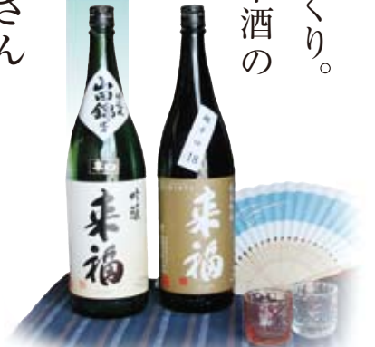
来福酒造では多くの人に、もっとお酒を知ってもらいたいと酒蔵を開放しています。お酒造りに興味のある人は必見です。試飲、きき酒も行っています。（要予約 来福酒造 ☎52-2448 まで）