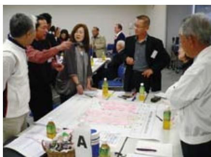
【昨年初めて開催された市民討議会】 23人の参加者が「筑西市を魅力あるまちにしよう」のテーマで話し合いました。