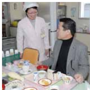
【軽食のサービス】手作りのものが利用から好評です。

査後に軽食のサービスがありま す。検査は朝食抜きで臨みます から、利用者にはとてもありが たいサービスです。美味しく いただきました。 今回初めて市民病院の人間 ドックを利用しましたが、職員 のきめ細かな対応で、スミーズ