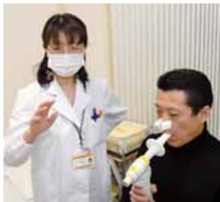
【肺活量の検査】肺いっぱい空気を含んで、一気に吐き出す時の空気量を測ります。

次は眼底、眼圧、聴力、視力の検査です。最近、老眼気味ですが、視力には自信があります。先生にも褒められました。 胸部レントゲン、心電図の検査、腹部超音波検査（エコー）を終えると、いよいよ胃の検査です。バリウム（白い液体です）を一気に飲み込み検査台の上