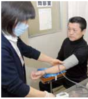
【血圧測定】検査が始まりました。まだ緊張しています。

「人間のドック？」話には聞けれど、どんなことをするのかよくわからない。わからなくて不安だから二の足を踏んでいる…という人も少なくないはず。そこで今回は私が、普段の不摂生を反省して、筑西市民病院で実際に人間ドックを体験してき