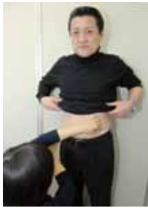
【腹囲計測】基準の85cmはクリアしました。安心しました。

「人間のドック？」話には聞けれど、どんなことをするのかよくわからない。わからなくて不安だから二の足を踏んでいる…という人も少なくないはず。そこで今回は私が、普段の不摂生を反省して、筑西市民病院で実際に人間ドックを体験してき