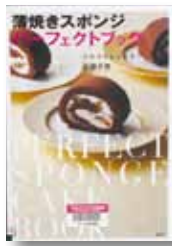
薄焼きスポンジ パーフェクトブック

◆食感が軽くて、しなやかな薄焼きスポンジの作り方を紹介。ロールケーキ、うず巻きケーキ、スペシャルな日のケーキなど、簡単テクニクのできる33品のレシピを収録。