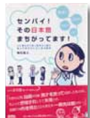
センパイ! その日本語 まちがってます! 著：植松 真人 【保育社】

◆「役不足」って自分の力より役が上?それとも下?使う場面や相手を間違えて使われていたり、間違っていることが多く日本語などを一挙に紹介し、正しい使い方を解説。