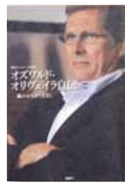
オズワルド・ オリヴェイラ自伝 著：オズワルド・オリヴェイラ 訳：高井 蘭童 【講談社】

◆人を説得し気持ちよく仕事をさせる、ことばの魔術力と柔軟な対応力。Jリーグ三連覇を遂げた名将、鹿島アントラーズの監督が、鹿島での三年間や、少年時代、コーチ時代を振り返る。