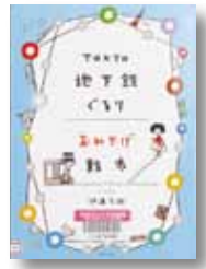
TOKYO 地下鉄ぐるり おみやげ散策 イラスト：伊藤 美樹 【ポプラ社】

◆浅草、銀座、表参道、神楽坂…。路線図をたよりに電車を出かけてみませんか。東京の人気エリアの見所や、贈って喜ばれるおみやげ等を、地下鉄の駅を基点に案内します。