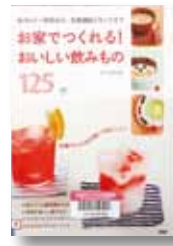
お家でつくれる! おいしい飲み物 125

◆お茶系飲みものから、食感が楽しい飲みもの、大人のカクテルまで、お家でつくれるドリンクレシピを紹介。おいしい紅茶・コーヒー・お茶の入れ方や果実酒の作り方なども掲載。