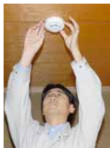
火災警報器は緊急通報システムと連動しています。

市では消防法の改正を受け今年度、一人暮らしの高齢者宅を対象に、504台の煙式火災警報器を設置しました。