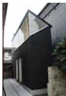
時の蔵に併設されている「蔵の谷間のトイレ」

下館・時の会は、「時の蔵」を保存活用した取り組みとまちづくりファンド事業を活用した「蔵の谷間のトイレ」の建設が高く評価されました。