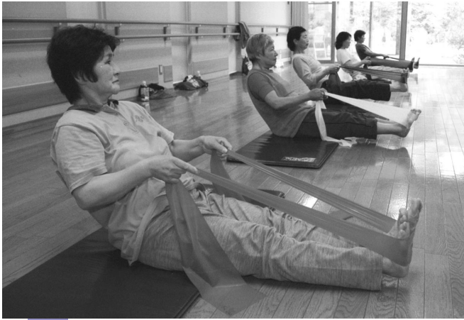
健康体操室で実施中のセラバンド教室

年齢を算出し、一人ひとりにあつた運動プログラムや栄養アドバイスを行います。活力年齢とは、実年齢とは異なり、その人の現在の健康度や老化度をあらわすもの。心臓病や脳卒中の発症を占ううえでも有効とされています。 水中エクササイズ (1回・200円) 室内温水プールを使い、水中ウォーキングを中心に楽しく体を動かします。運動を始めたばかりの人や、膝・腰に痛みのある人にもお勧めです。 セラバンド・エクササイズ (無料) セラバンドと呼ばれるゴム製のバンドを使った簡単筋力トレーニング。誰でも参加できるセラバンド・エクササイズと、65歳以上の人を対象にしたセラバンド教室を開催しています。