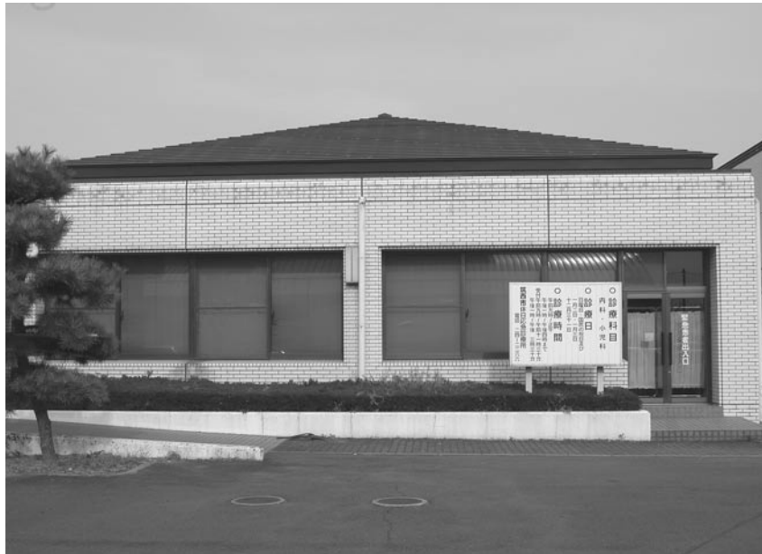
筑西市休日応急診療所（下館保健センター内）