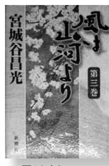
風は山河より 著 = 宮城谷昌光 全5巻(写真は第3巻) 【新潮社】

動乱の歴史を生きた三河の菅沼家を3代にわたって描く。野田城主・菅沼定則は、帰属先の今川家の新当主が凡庸なため、台頭著しい松平清康（徳川家康の祖父）につくことにするが…。