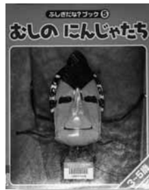
むしのにんじゃたち 写真 = 海野和男 【世界文化社】

体が木の葉にそっくりなコノハムシ、木の枝にそっくりなエダナナフシなど、忍者のように変身する昆虫たちが美しい写真で紹介されています。虫たちはどこに隠れているのでしょうか。