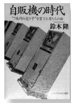
自販機の時代 著 = 鈴木隆 【日本経済新聞出版社】

紀元前3世紀からある自動販売機が日本に広まったのは、ここ40年程のこと。その間、様々な企業による開発・製造・販売のドラマがありました。その様子を生き生きと描いた本です。