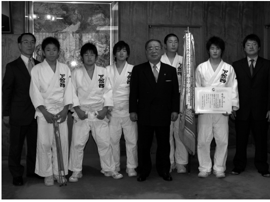
市長に優勝報告をした下館西中柔道部のみなさん