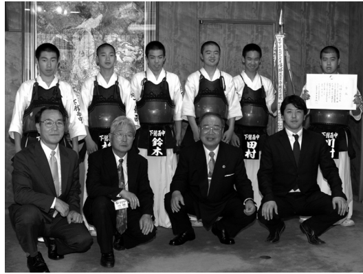
市長に優勝報告をした下館西中剣道部員のみなさん