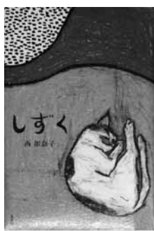
しずく 著 = 西加奈子 【光文社】

10年ぶりくらいで偶然再会した幼なじみ。なぜか彼女とふたりで、ロスへ旅行することに…。『ランドセル』をはじめ、少し笑えて結構せつない、「女どうし」を描く6つの物語。