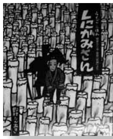
しにがみさん 原作 = 柳家小三治 作・絵 = 野村たかあき 【教育画劇】

丹精な版画による江戸落語絵本。死神はお金に困っている若い夫婦を助けるが、父親は金に目がくらんで自分の寿命を金と交換してしまふ……。こどもからおとなまで楽しめるお話です。