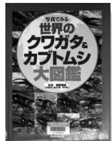
写真でみる世界のクワガタとカブトムシ大図鑑 監修 = 高家博成 【PHP研究所】

世界各地にすむクワガタやカブトムシの中から、日本への輸入が解禁されたものを中心に鮮明な写真で紹介しています。外国産クワガタ・カブトムシの飼育方法なども紹介されています。