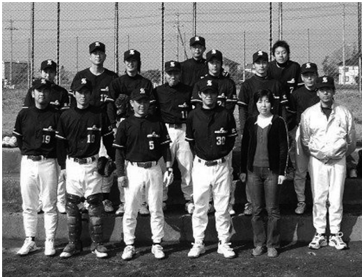
優勝した関彰商事チーム

4月15日・22日 下館市民球場ほか ■優勝 関彰商事 ■準優勝 下館キャッツ ■第3位 ホープ川島、ルーキーズ