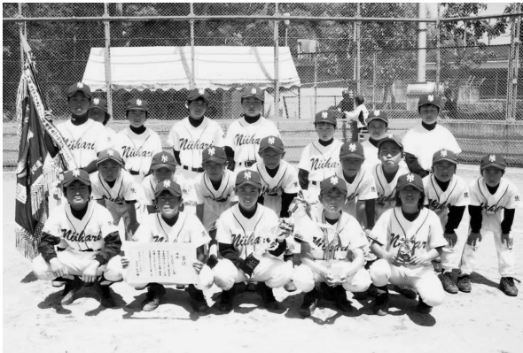
優勝した新治野球スポーツ少年団チーム

4月28日・29日 明野球場ほか ■優勝 新治野球スポーツ少年団 ■準優勝 養蚕あしマススポーツ少年団 ■第3位 松原シルバリーイーグルス、古里野球スポーツ少年団