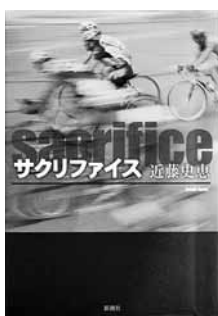
サクリファイス 著＝近藤史恵 【新潮社】

◆自転車ロードレースで日本有数の選手・石尾にはある疑惑があった。台頭著しい若手を、事故を装って潰したという。信じられないチカだったが、あるレース中自分が総合1位になり…。