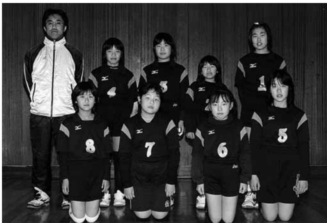
女子の部で県大会出場を果たした明野チームのみなさん