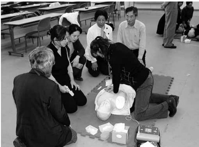
■普通救命講習会についての問い合わせは、下館消防署（Tel. 24-4504）へ。

市内では、AEDの設置は一部の市庁舎、学校、病院、体育館などに限られ、十分に普及していないのが現状です。今後、スーパーや娯楽施設、会社など多くの場所に設置されることを願っています。そして、緊急時には、だれもが積極的に救命活動を実行してほしいと思います。いざという時にかけがえのない命を救えるよう、みなさんもぜひ一度、普通救命講習会に参加してみませんか。