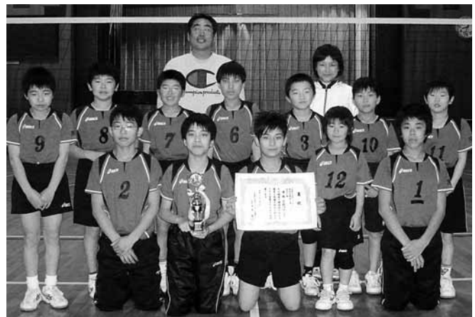
男子の部で優勝した下館はやぶさチームのみなさん