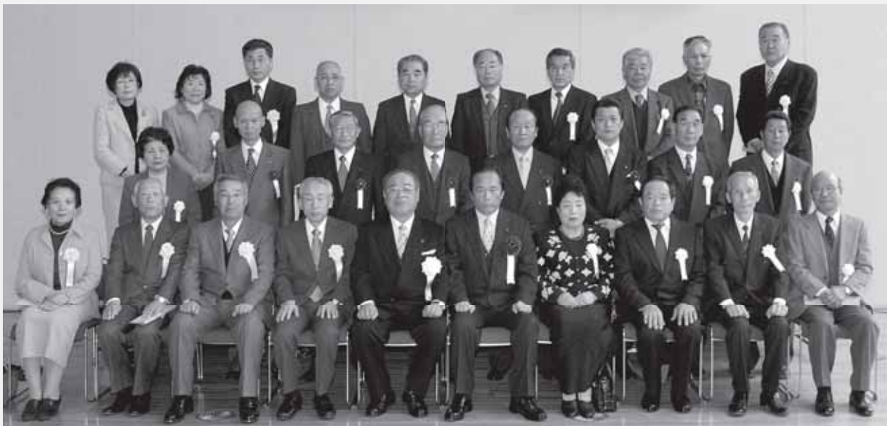
叙勲・褒章受章者及び市政功労者のみなさん

春の宴会ご予約承り中!! ゆっくりくつろげるお座敷席をご用意しておりますので、ご家族やお友達との食事も、法要や歓送迎会などのご宴会でもご利用いただけます。 ■飲み放題プランあり ■8名様より無料送迎 ■40名様までご利用可