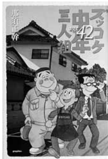
ズッコケ中年三人組 age42 著＝那須 正幹 【ポプラ社】

◆架空の町の稲穂県ミドリ市花山町を舞台にした「ズッコケ三人組」シリーズ。ハチベエ、ハカセ、モーちゃんも42歳。今回はモーちゃんの娘とハチベエの長男の物語。フォークデュオ・ゆずも登場。