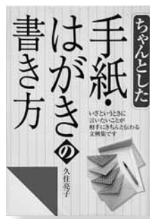
ちゃんとした手紙・ はがきの書き方 著＝久住亮子 【西東社】

◆手紙の基本と、様々な場面の文例を紹介した本。手紙の基本は、時候のあいさつ、封書とはがきの使い分け方、宛名の書き方など。文例は、季節の手紙、冠婚葬祭関連文、通知文などです。