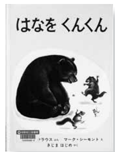
はなをくんくん 文＝ルース・クラウス、絵＝マーク・サイモント、訳＝きじまはじめ 【福音館書店】

◆雪の中から、ねむっていた動物たちが目をさます。みんな、はなをくんくん。みんな、かけてく。土の中から、木の中から、みんなかけてく。いったい、どこへ行くのだろうか？