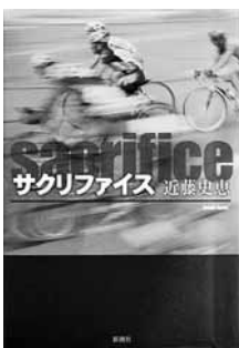
サクリファイス 著＝近藤史恵 【新潮社】

◆自転車ロードレースで日本有数の選手・石尾にはある疑惑があった。台頭著しい若手を、事故を装って潰したという。信じられないチカだったが、あるレース中自分が総合1位になり…。