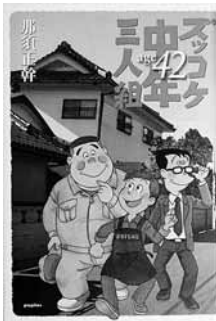
ズッコケ中年三人組 age42 著＝那須 正幹 【ポプラ社】

◆架空の町の稲穂県ミドリ市花山町を舞台にした「ズッコケ三人組」シリーズ。ハチベエ、ハカセ、モーちゃんも42歳。今回はモーちゃんの娘とハチベエの長男の物語。フォークデュオ・ゆずも登場。