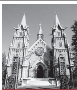
県下最大級の「アナパレナ大聖堂」で永遠の愛を誓う！！

茨城県後期高齢者医療広域連合（制度）TEL 029-309-1212（保険料）TEL 029-309-1213 市保険年金課医療福祉係 TEL 24-2111（内線243） http://www.ibaraki-kouikirengo.ecnet.jp/