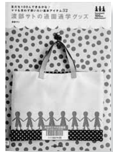
渡部サトの 通園通学グッズ 訳＝渡部 サト 【河出書房新社】

◆丸フェルトのバッグとシューズバッグや、ドットの中着と弁当袋、フアイエ×チエックの車バッグなど、ママも思わず使いたくなるような通園通学グッズ32を紹介します。