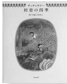
チッチとサリー 初恋の四季 著＝みつはし ちかこ 【学習研究社】

◆青春のときめき、人を想うせつなさ…。名作漫画「小さな恋のものがたり」のチッチとサリーが美しい花々と奏でる初恋の詩。初期作品から描き下ろし作品まで34点を収録した詩画集。