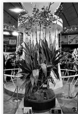
▲日本大賞受賞作品