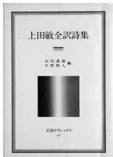
上田敏全訳詩集 編=山内義雄、矢野峰人 【岩波書店(岩波クラシックス)】

◆山のあなたの空遠く／「幸」住むと 人のいふ。(カール・ブッセ作「山のあ なた」より「海潮音」所収) 約100 年前の訳詩集です。旧字体ですがふり がなも多く、美しい言葉が味わえます。