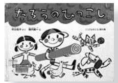
たろうのひっこし 作=村山桂子 絵=堀内誠一 【福音館書店】

◆「このじゅうたんを広げたところが たろうのお部屋よ。」たろうはじゅう たんを持って階段の下へ、ねこのみー やと一緒にでまどの下へ、犬小屋の前 へ…。この時期にぴったりの本。