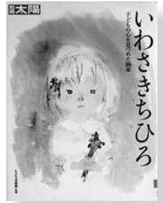
いわさきちひろ 監修=ちひろ美術館 【平凡社】

◆子どもたちの繊細でみずみずしい心 を表現する絵を描いたいわさきちひろ。 その人生の軌跡を写真や作品を織り交 ぜ綴る。ちひろの絵本の世界、こころ のふるさと信州探訪、エッセイも収録。