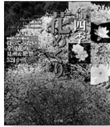
全国四季花めぐり データ：2008年1月現在 【小学館】

◆春の桜、夏の花苧蒲、秋の彼岸花、冬の寒椿…。ぜひ訪れてみたい日本全国の花の名所を、四季の花ごとにまとめた、「花を愛でる旅」に役立つ情報満載の案内書。「四季の花図鑑」も収録。