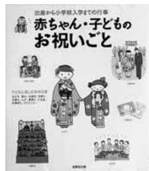
赤ちゃん・子ども のお祝いごと 編=成美堂出版編集部 【成美堂出版】

◆妊娠5か月の帯祝いから小学校入学 までの行事の本。行事の由来ややり方、 お礼のしかたも書いてあります。また、 年中行事、祝儀袋の使い方、子どもの 成長等にもふれています。