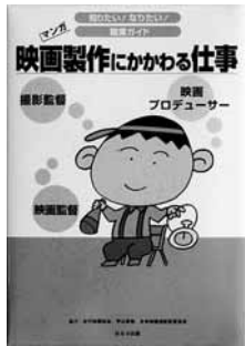
知りたい! なりたい! 職業ガイド 映画製作にかかわる仕事 【ほるぷ出版】

◆映画プロデューサー、映画監督、撮影監督といった映画製作にかかわる仕事を、現場で働く人のインタビューとともに紹介。仕事のようすやその職業に就くための方法、適性診断も収録。