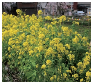
村田三所神社周辺に咲く菜の花は、地元の人たちが種を蒔いたもの。鮮やかな黄色い花が、子どもたちの安全をいつも見守っています。

真岡線 S L が初取材となりました。平成 6 年より運行し、今年で 14 年目を迎えるが、走る姿を見ようと今も多くのファンが足を運んでいる。今後も夢をのせて走り続けてほしい。(か)