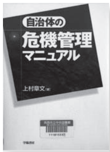
自治体の危機管理マニュアル 著：上村章文 【学陽書房】

◆災害・事故・不祥事などの危機発生時における組織体制や業務手順、避難情報の伝達のほか、平常時から取り組むべき人材育成の進め方などを体系的に解説する。