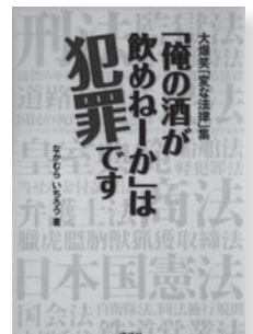
大爆笑「変な法律」集「俺の酒が飲めねーか」は犯罪です 著：なかむらいちろう 【講談社】

◆総理大臣を「くじ」で決定しているの？ 暴走族に手を振っただけで罰金？ ウェブサイト「変な法律」の中から、「なんだ、これは？」と言いたくなる、選りすぐりの「変な法律」を紹介する。