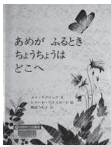
あめがふるときちようちようはどこへ 文：メイ・ゲアリック 絵：レナード・フェイスガード 訳：岡本うた子 【金の星社】

◆あめ、あめ、あめ、あめ、あめ。あめがふるとき、ちようちようは、どこへいくのかしら。もぐらは穴にもぐれます。みつばちは巣にかえれます。でも、ちようちようは、どこへいくのかしら。