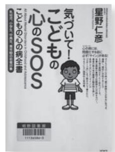
気づいて！こどもの心のSOS 著：星野仁彦 【ヴォイス】

◆「心の病」には、問題化する前に必ず「サイン」がある。各障害ごとに、子どもが送るサイン、原因、治療法、サポート法などを豊富な臨床例をもとにわかりやすく解説する実用百科。