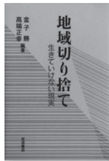
地域切り捨て 生きていけない現実 編著：金子勝、高端正幸 【岩波書店】

◆いま、地方が悲鳴をあげている。中曽根政権にはじまる「民活」、小泉政権で大きく舵を切った「官から民へ」の政策は、地方に何をもたらしたのか。その現状をルポし、オルタナティブを提示する。