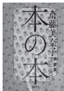
本の本 著：斎藤美奈子 【筑摩書房】

◆各紙で書評を書いていた著者初めての「いわゆる書評」集。小説、科学書、写真集、児童書、歴史書、ジェンダー論など、様々なジャンルの本を扱い、テーマ毎にまとめています。