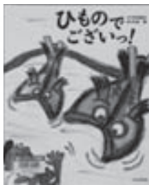
ひものでございっ！ 文：平田 昌広 絵：平田 景 【文化出版局】

◆民宿のよりもおいしい干物とは、とれたての魚で作るとうちゃん干物！鰯を開いて、つけ汁を作り、秘密のエキスを入れて…。僕の夏休みのいちばんの思い出。レシピつき。