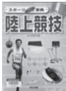
スポーツなんでも事典 陸上競技 編：こどもくらぶ 【ほるぷ出版】

◆陸上競技の歴史、ルールや特徴、名選手や陸上競技選手の生活など、陸上競技に関わるさまざまな事柄をテーマごとに解説。その他野球、ゴルフ、サッカー等の巻もあり。