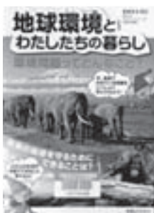
地球環境とわたしたちの暮らし 監修：住 明正 【実業之日本社】

◆地球温暖化などの環境問題と環境問題に取り組む世界の動きを解説。わたしたちの身近でおこっている環境問題も紹介し、普段の生活の中でわたしたちができることを提案