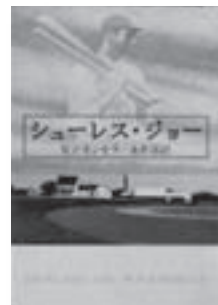
シューレス・ジョー 著：W.P. キンセラ 訳：永井 淳 【文藝春秋】

◆不思議な声に導かれ、レイが畑を野球場になると、死んだ筈の名選手が現れた。次に声は、見ず知らずの作家・サリンジャーの苦痛をやわらげるよう指示。レイは彼に会いに行くが…。