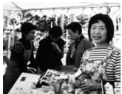
バザーを行なうしもだて女性セミナーのみなさん

会設立に積極的に関わり、その中心的存在として同会の事業を推進しながら、研修を重ねています。