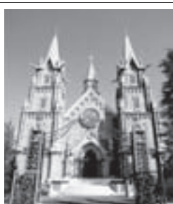
県下最大級の「アンナベリナ大聖堂」 で永遠の愛を誓う！！

男女共同参画社会に関する ご意見をお寄せください。 男女共同参画課 (TEL 23-1600)