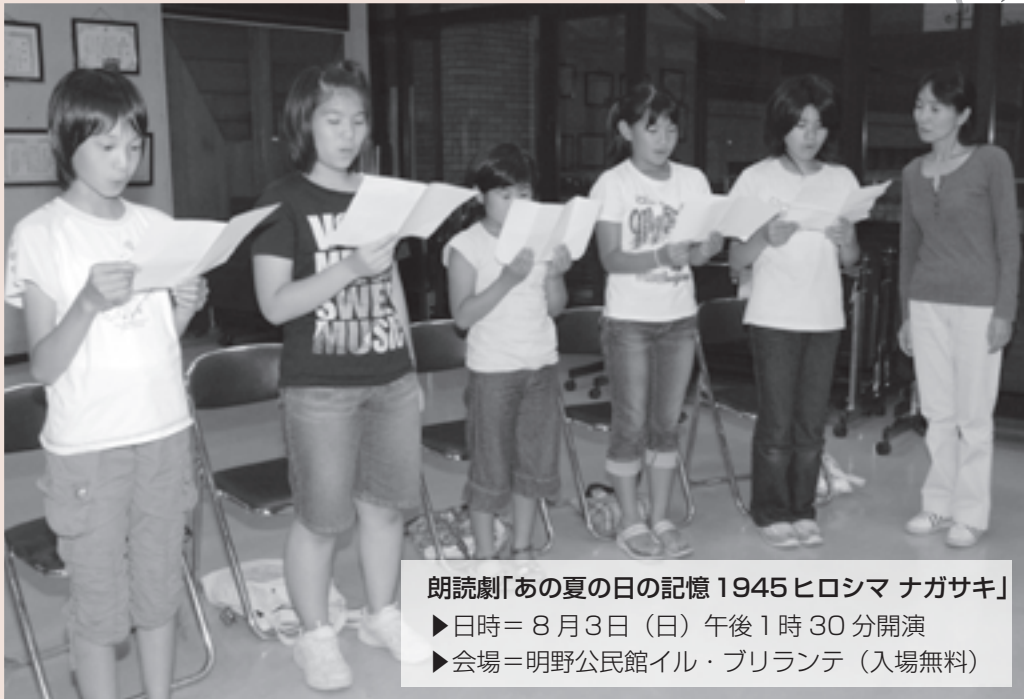
朗読劇「あの夏の日の記憶 1945 ヒロシマ ナガサキ」

▶日時＝8月3日（日）午後1時30分開演 ▶会場＝明野公民館イル・プリランテ（入場無料）