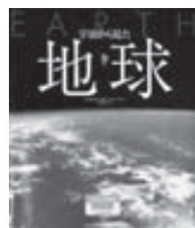
宇宙から見た地球

◆ダイナミックに呼吸する地球の全体像を最新の膨大な衛星画像データを駆使して見せる高精度の写真集「大地・水・大気・火」という4つの視点から地球のさまざまな実像に迫る。