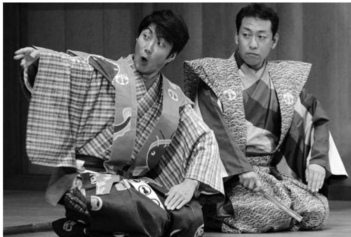
会場を沸かせた、狂言「成上り」(野村萬斎氏ほか)