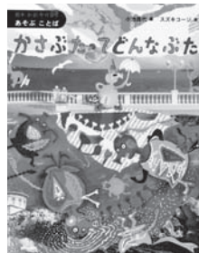
かさぶたってどんなぶた 編：小池 昌代 画：スズキ コージ 【あかね書房】

◆かさぶたってどんなぶた(山中利子) おならうた(谷川俊太郎)、おにいちちゃんおになつた(岸田裕子)などの詩がたくさん入った本。最後に小池昌代さんからの手紙がついています。