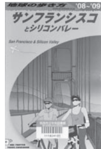
地球の歩き方 '08~'09 サンフランシスコとシリコンバレー 【ダイヤモンド・ビッグ社】

◆海外旅行の定番。「ゴールデンゲート・ブリッジを自転車で渡ろう!」ほか、サンフランシスコのおすすめお土産や、サンフランシスコ&シリコンバレーの最新情報が満載です。