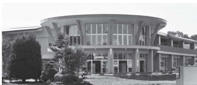
祝 明野中学校校舎改築工事竣工式

新校舎は多様な学習形態に対応できる多目的スペースや情報化に対応したコンピュータ室と図書館を一体化したメディアセンターを設置。また地域との連携を図るコミュニティホールなどが整備されています。