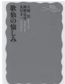
歌仙の愉しみ 著：大岡 信 著：岡野 弘彦 著：丸谷 オー 【岩波書店】

◆五七五の長句と七七の短句を何人かで交互に組み合わせる連句のうち、三十六句仕立てのものを歌仙といいますが。鞍馬天狗、くらげなどが登場する遊び心いっぱいの俳諧入門。