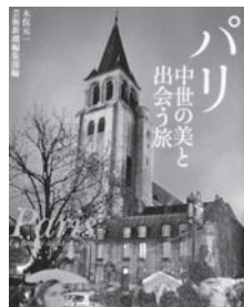
パリ 中世の美と出会う旅 著：村上 祥子 編：芸術新潮編集部【新潮社】

◆ルーブルやノートルダム意外なみどころから、街なかの小さな教会、古の城壁、シャルトルやサンリスといった郊外まで、歩き方ガイド&詳細地図付きで案内する。