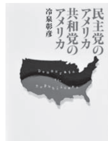
民主党のアメリカ・共和党のアメリカ (日経プレミアムシリーズ) 著：冷泉 彰彦 【日本経済新聞社】

◆民主党リベラル、共和党保守は本当なの? 銃規制・公的医療保険・対外戦争への賛否などの両党の対立軸について、映画やスポーツなどを例に気鋭のアメリカウォッチャーが分析。