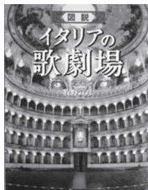
図説イタリアの歌劇場 著：牧野 宣彦 【河出書房新社】

◆オペラの殿堂ミラノ・スカラ座、イタリア一美しい劇場レッジョ・エミリア。世界一有名な劇場から、世界一小さい劇場まで、イタリアの全40都市50以上の劇場を紹介。