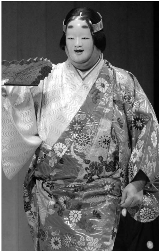
幽玄の世界へ誘う、能楽「班女」(観世鍊之丞氏ほか)