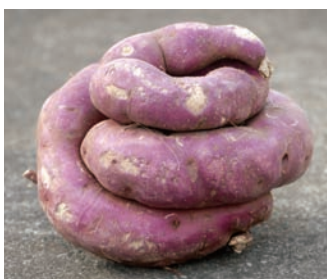
グループホーム「ひまわり」(吉田)の畑から、ヘビのようなサツマイモ(ヘニアズマ)が収穫されました。入所者も驚きの様子。

現在400以上の自治体で実施しているインターネット公売。全国から入札が可能で、品物によっては市場価格を上回るなど、税収増加が期待できる。少しでも滞納が減れば……(か)