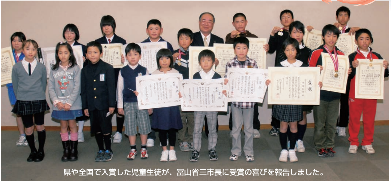
県や全国で入賞した児童生徒が、富山県三市長に受賞の喜びを報告しました。