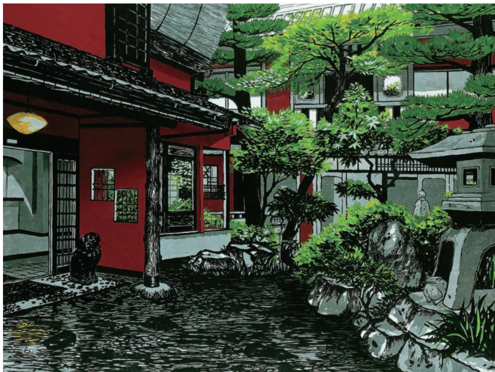
「紅楼依緑」2005年 第37回日展特選