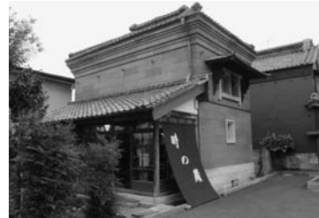
◀市民団体の活動の拠点となっている石蔵 まちづくりファンド事業によりトイレが設置され、さらなる活用が期待されます。

協働はそれ自身が「目的」ではなく、単なる「手法」のひとつに過ぎません。協働の真の目的である「よりよい地域づくり」のために、市民と行政が互いに力を出し合い、協力していきましょう。