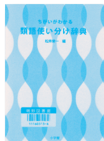
ちがいがわかる 類語使い分け辞典 編：松井 栄一 【小学館】

◆「あがる」と「のぼる」、「夫婦」と「夫妻」など、同じような意味の言葉の違いを知る辞典。それぞれの言葉の意味と違いを、イメージ図、表現例を用いて解説している。索引つき。