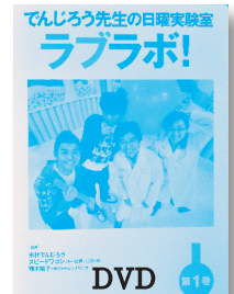
てんじろう先生の日曜実験室 ラブラボ! 第1巻 制作著作：中京テレビ 【丸善】

◆身の回りにあるものを使って、楽しく見て学ぶ科学実験！第1巻では空気砲、ゴムの不思議、視覚の不思議を米村でんじろう先生が分かりやすく解説します。