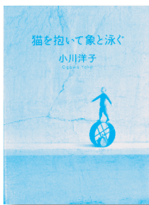
猫を抱いて象と泳ぐ 著：小川 洋子 【文藝春秋】

◆廃バスに住む巨漢のマスターに手ほどきを受け、チェスの大海原に乗り出した孤独な少年。彼の棋譜は詩のように美しいが、その姿を見た者はいない。なぜなら…。