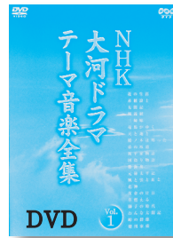
NHK大河ドラマ テーマ音楽全集 Vol.1 【NHKエンタープライズ】

◆壮大なスケールで人物の人生を描く大河ドラマ。そのオープニングに流れるテーマ音楽を紹介。第1弾では昭和38年の「花の生涯」から昭和58年放送の「徳川家康」まで21作品を収録。