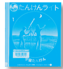
たんけんライト3 宇宙たんけん 原案・制作：クロード・デラフォス他 訳：石井 玲子 絵：ドナルド・グラント 【岳陽舎】

◆空のかなたには、いったいなにがあるのだろうか？ひこうき、月、星、人工衛星などを、魔法のライトでさがしたそう。シリーズ他に、恐竜、魔法つかいとオバケ、夜の生き物など。