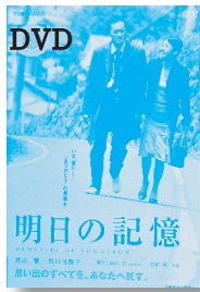
明日の記憶 原作：荻原浩 【東映ビデオ】

◆50歳という働き盛りに若年化アルツハイマーに冒されてしまったサラリーマンと、そんな夫を支えて寄り添うように生きていく妻の姿をとらえた感動の夫婦愛ストーリー。