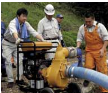
災害時に迅速に対応するため、市職員がポンプの操作訓練を行いました。

水ポンプの操作訓練を、5月13日、勤行緑地で実施しました。訓練には、大型ポンプ2台と中型ポンプ3台を使い、市総務部と土木部の職員、筑西消防署員約35人が参加。水をくみ上げるための機械操作を念入りに確認しました。