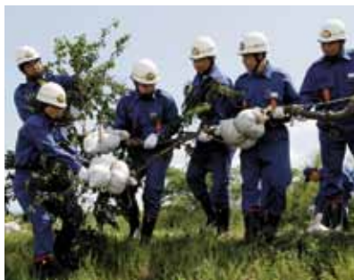
出水に備え、「五徳縫い」や「木流し」などの水防工法を訓練しました。

訓練には、初めて参加した女性分団を含め、全44分団から約500人が参加。県筑西土木事務所職員の指導で、土のうをこしらえたり、堤防への水の勢いを和らげる「木流し」、堤防の亀裂の拡大を防ぐ「五徳縫い」など、きびきびとした動きで取り組んでいました。