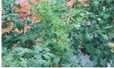
【黄化葉巻病の症状】①芯葉が黄色くなり、成長が止まります。②芯葉近くの葉はまだ模様になります。③わき芽も同様に芯が黄色くなり、成長が止まります。

●黄化葉巻病はタバコナジラミという昆虫により伝染するトマトの病気です。発病すると、トマトの成長が止まり、果実が採れなくなります。この病気は治療薬が無いため発病すると治りません。また、伝染力が強いので、家庭菜園の数本の病気のトマトからでも、地域のトマト農家の畑に大きな被害を及ぼします。