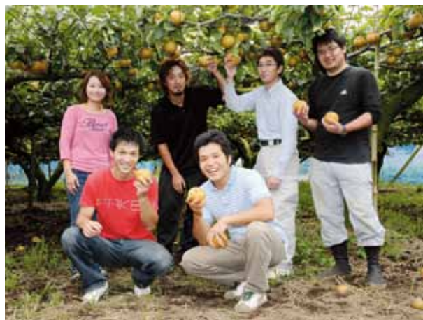
▲有機農法栽培を取り入れ、梨づくりをしている市村農園にて