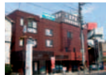
志学教育センター (下館駅北校)