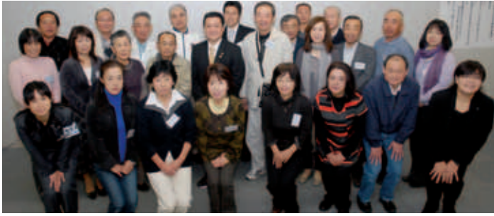
討議会は16歳以上の市民2000人を無作為に選出。その中から参加者を募った結果、34人が応募、討議会には23人が出席しました。

筑西市を魅力あるまちに 市民討議会で活発な意見 市と下館青年会議所による市民討議会が10月25日、しもだて地域交流センターで開催され、23人の参加者が「筑西市を魅力あるまちにしよう」のテーマで話し合いました。討議会では、理想のまちにするために「医療・福祉の充実」を求める声があったほか、「行政事業への市民参加の促進や隣人とのコミュニケーションの推進」といった自らが積極