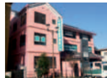
東進衛星予備校 (下館駅北校) スピカ裏