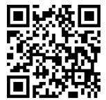
Fun to Ride