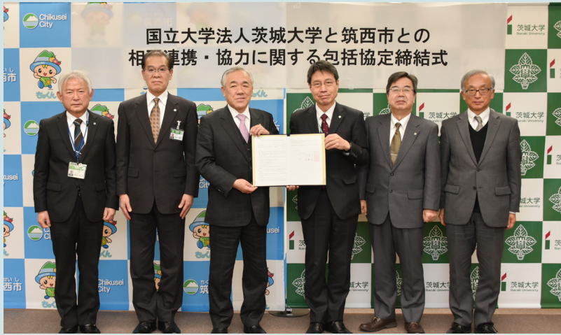
国立大学法人茨城大学と筑西市との 相互連携・協力に関する包括協定締結式