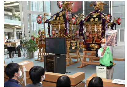
フィールドワークでは、身近なところにあった新たな発見に、学生たちから驚きの声が上がっていました。

学生たちは、アルテリオや羽黒神社、中館観音寺、母子島遊水地、ザ・ヒロサワ・シテイを巡り、ガイドの説明に耳を傾けながら市内の観光スポットへの理解を深めていました。