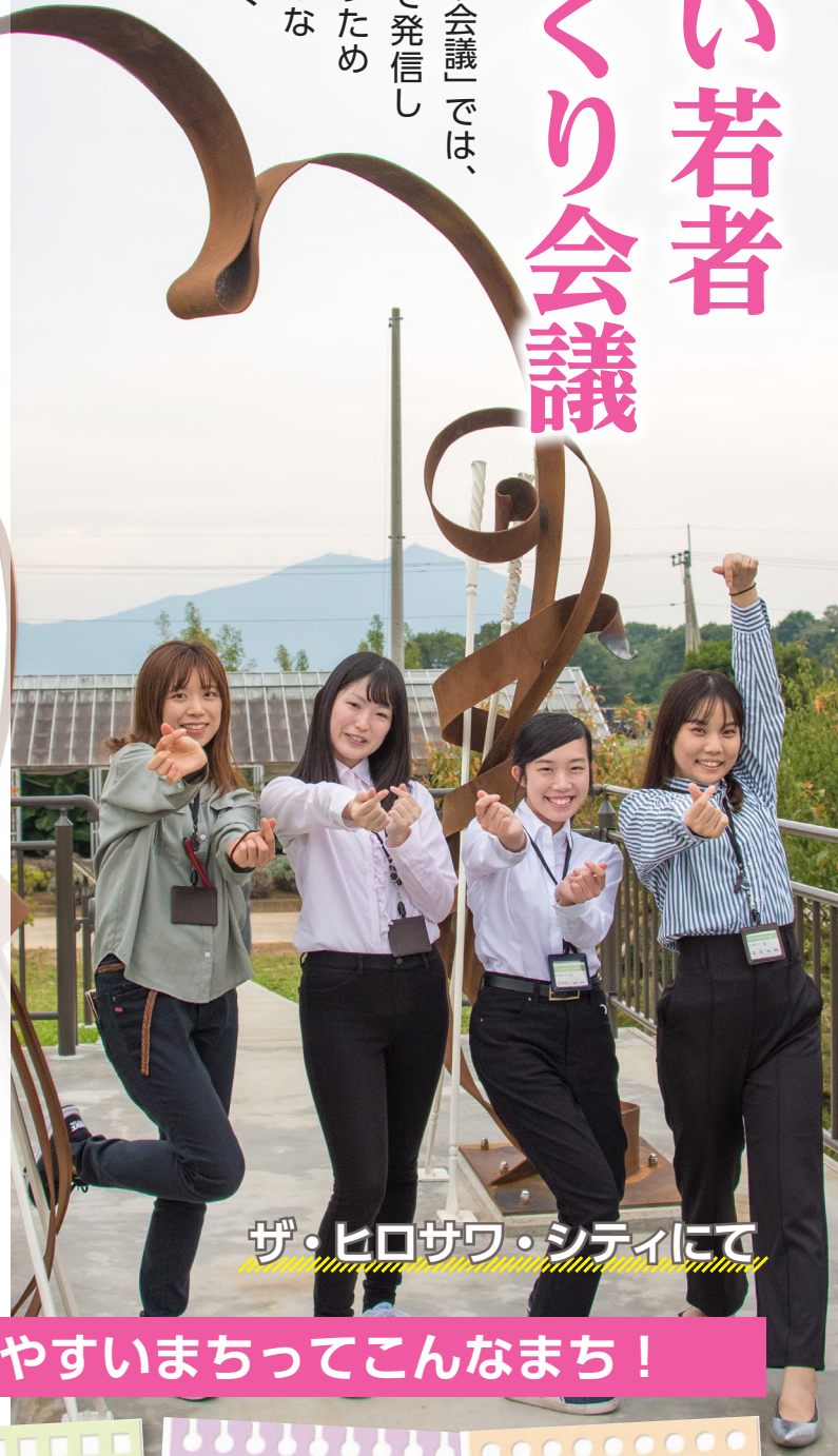
ザ・ヒロサワ・シティにて

「ちくせい若者まちづくり会議」では、筑西市の魅力やSNSで発信したり、賑わいを創り出すための方策を作成したりするなど、学生目線で地域づくりを考えます。動き出した、学生たちの活動を紹介します。