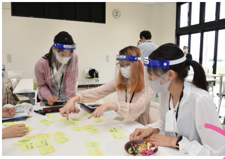
グループにわかれ、課題をふせんに書き出し、魅力あるまちづくりの方法を考えました。

本市が抱える課題を見つけ、改善点を提案するため、「あなたにとって住みやすいまち（魅力あるまち）ってどんなまち？」をテーマに、ワークショップを行いました。学生たちからは「おいしいカフェなどおしゃれな店がたくさんあるまち」、「イベントがたくさんあり、活気のあるまち」など、若者の視点から、さまざまな意見が飛び交いました。