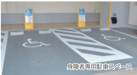
身障者専用駐車スペース