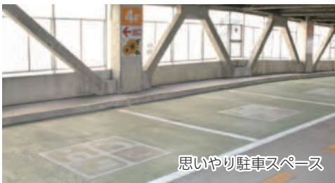
思いやり駐車スペース

市役所本庁舎の北側入口と立体駐車場に「身障者専用駐車スペース」、平面駐車場と立体駐車場の各階に「思いやり駐車スペース」を設置しています。利用の際は、他の人からもわかるように、車内のルームミラーなどに利用証を掲示してください。利用証がないと利用できないわけではありませんが、適正な利用にご協力をお願いします。