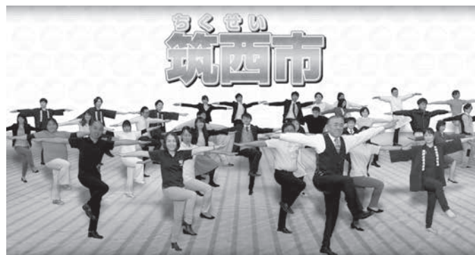
筑西市魅力発信P R動画