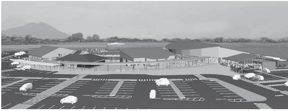
道の駅完成イメージ図