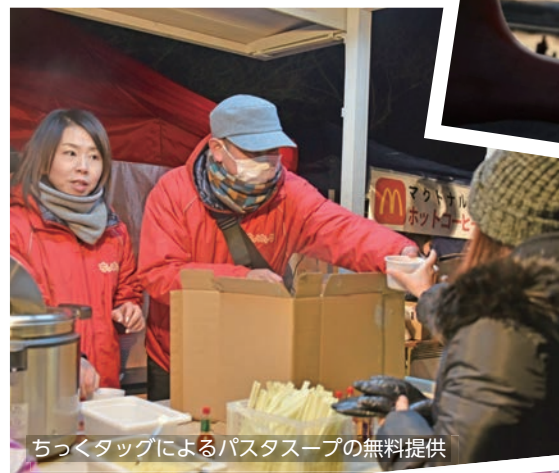
ちくくタグによるパスタスープの無料提供