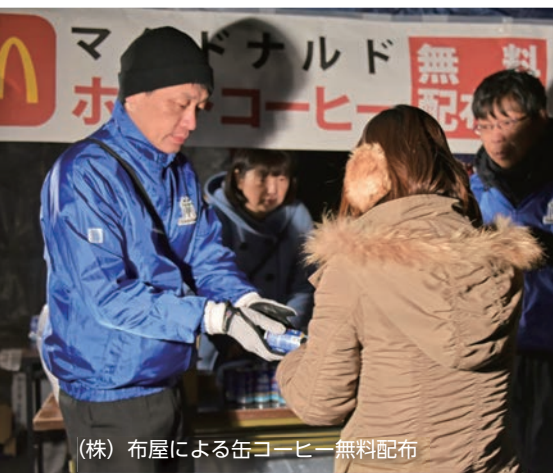
(株) 布屋による缶コーヒー無料配布