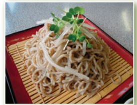
すすしろ(天根)そば

自然を思い切り楽しめるアウトドア体験施設です。バーベキュー場やキャンプ場、ジャブジャブ池、遊具、陶芸工房など、様々な体験が楽しめます。また、農産物直売所あけのアグリショップに併設されたそば処では、名物すすしろそばなど、常陸秋そばを味わうことができます。