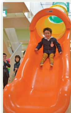
トンネルスライダー

トンネルスライダーや大型ボールプール、ボルダリング、お絵かきボード、ロディ、ちっくんバルーンなどを備えた屋内の遊び場です。おもちゃ交換台、授乳スペースもあり、保護者も安心して利用できます。※必ず保護者が一緒に利用してください。ゴールデンウィーク中もご利用いただけます。