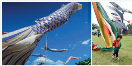
▲鯉のぼり (4月29日～5月14日)