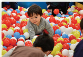
大型ボールプール