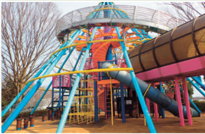
大型遊具ローラーライダー

多目的運動広場、テニスコート、スケートボードやインラインスケートの練習場、大型遊具ローラーライダーやチューブトンネルがある子ども広場など、スポーツとレクリエーションを楽しめる総合公園です。