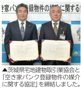
▲茨城県宅地建物取引業協会と「空き家バンク登録物件の媒介に関する協定」を締結しました。