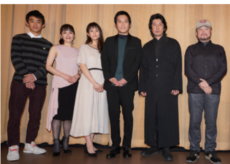
▲舞台あいさつする主演キャストと五十嵐監督 イオンシネマ下妻などで絶賛上映中

ぜひ、劇場でご覧いただき、ひとりでも多くの人に命の大切さを感じてもらえれば幸いです。