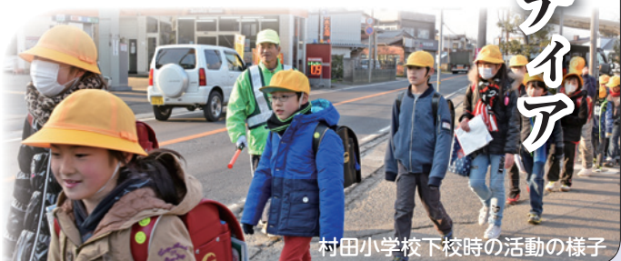
村田小学校下校時の活動の様子

多くの方のご協力をいただき、現在の登録者は6,507人（1月現在）となりました。これまでのみなさんの活動に感謝するとともに、安心して暮らせるまちを目指して、より一層のご理解・ご協力をお願いします。