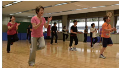
元気ひろばのエアロビクス教室

キットトレーニング、ボクシングエアロ、そして子ども運動教室などが行えるようになりました。これにより健康体操室に加えてプログラムの数が倍になったそうです。