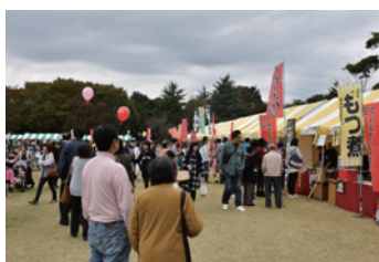
▲会場はたくさんのお客さんでにぎわいました

さらに、B-8グルメうっまいフェスティバルでは、地元産の野菜や米を使用したオリジナルメニューの販売を行い、大にぎわいの2日間となりました。