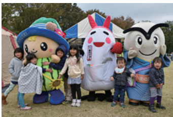
▲遊びに来てくれたちっくん、まかぴよん、まゆげった

俵投げや米つまみ競争などのお米をテーマにした種目のほかに、熱気球体験や重機体験など様々なコーナーが設置されました。