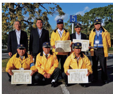
▲関東防犯協会表彰と茨城県防犯協会表彰で受賞されたみなさん