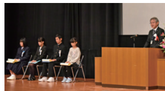
▲「理科読」「算数・数学読」感想文コンクール表彰の様子

今年で10回目となる「筑西市教育の集い」が、11月15日、明野公民館大ホール（イル・ブリランテ）で開催され、市内の小中学生、教育関係者、学校を支援くださる人たちが一堂に会しました。