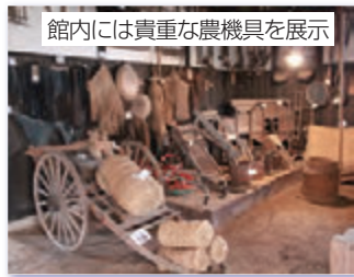
館内には貴重な農機具を展示

館内には農作業で使われた千石通しや唐箕など昔の道具が市民から寄贈され、展示されています。さらに置の座敷をのぞくと、今ではすっかり姿