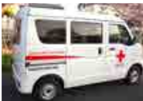
▲配備された救援車

救援車は、日常業務のほか、万一の火災・風水害時における救護活動や社会福祉活動に利用されます。