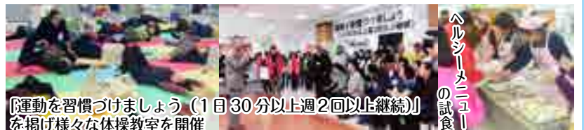
「運動を習慣づけましょう(1日30分以上週2回以上継続)」を掲げ様々な体操教室を開催

約100人のボランティアスタッフとともに、約300人の参加者は、リズム体操などで体を動かし、ヘルシーメニューを食べるなど日頃から取り組むことができる健康づくりを学びました。