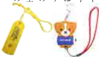
▲防犯笛 (左)、防犯ブザー (右)

(株)常陽銀行下館支店からの寄贈は今年で11回目。今年のブザーは柔らかいシリコン製のもので、より安全に使えるものです。