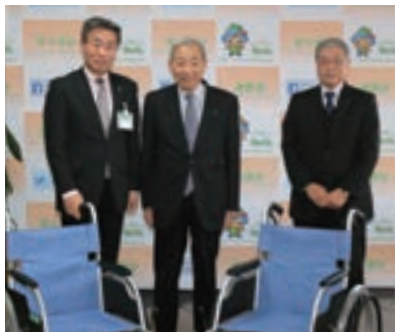
▲（一社）下館法人会様