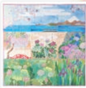
「富士山と鎌倉の花々」